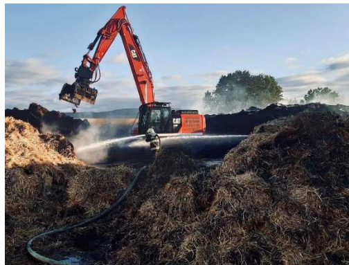
Srpen – požár – seník v Rožmitále pod Třemšínem