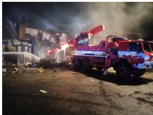
Leden – požár objektu v Praze