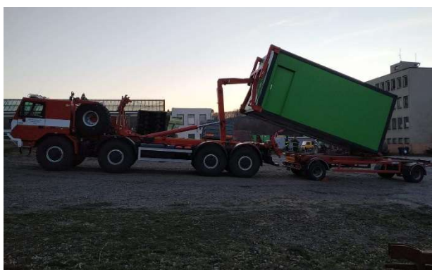
Přeprava kontejnerů sloužících jako odběrová místa při testování.