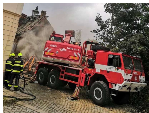
Srpen – technická pomoc – rozebírání konstrukcí a demolice objektu v Roudné