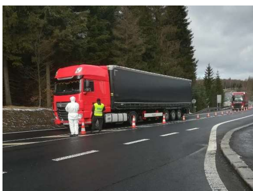
Výstavba a provoz zázemí pro složky IZS a měření teploty osob na hranicích ČR.