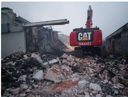
Leden – požár výrobní haly v Holasicích