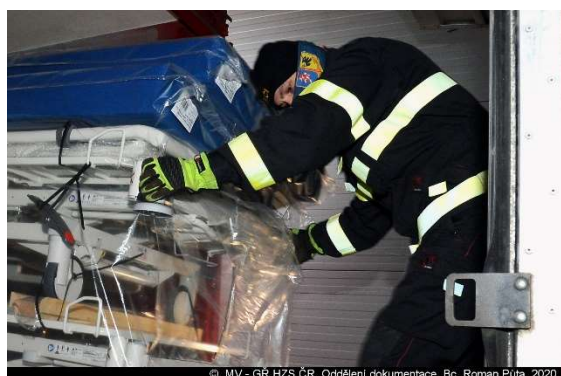
Přepravy nemocničních lůžek ze skladů do vybraných nemocnic.