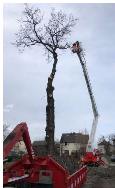
Rizikové kácení stromu.