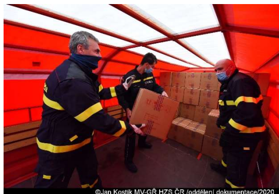
Distribuce ochranných pomůcek ze skladů do všech krajů ČR.