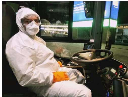
Přepravy občanů ČR ze zahraničních letišť a destinací zpět do republiky.