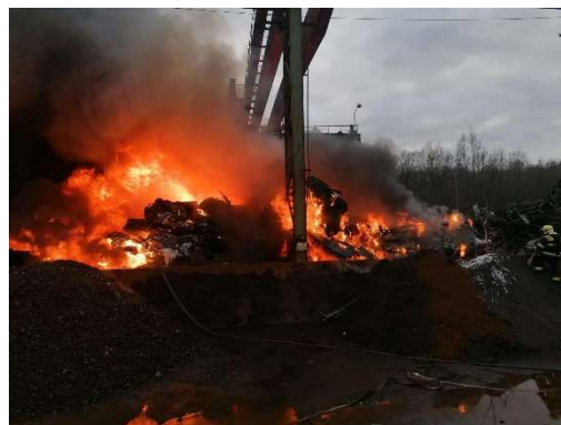
Únor – požár ve firmě na zpracování autovraků v Dříní