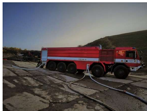
Říjen – požár – skládka odpadu ve Voticích