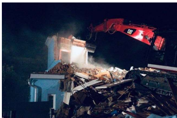
Září – technická pomoc – částečná demolice RD a odstranění sutin v Liberci