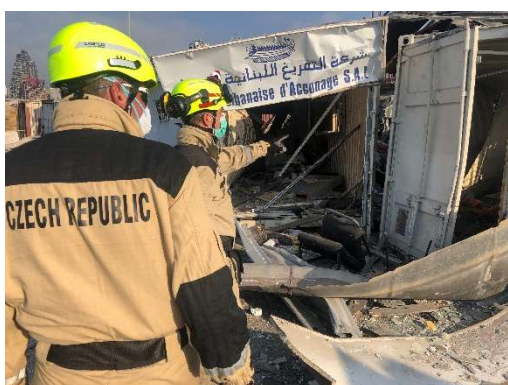
Srpen – mezinárodní záchranná operace – vyhledávání osob po explozi v Bejrútu