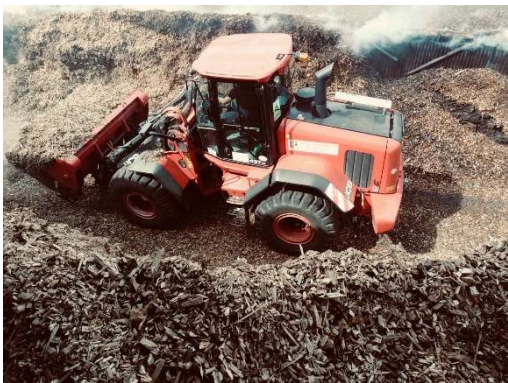
Srpen – požár – uskladněná štěpka v obci Postoloprty