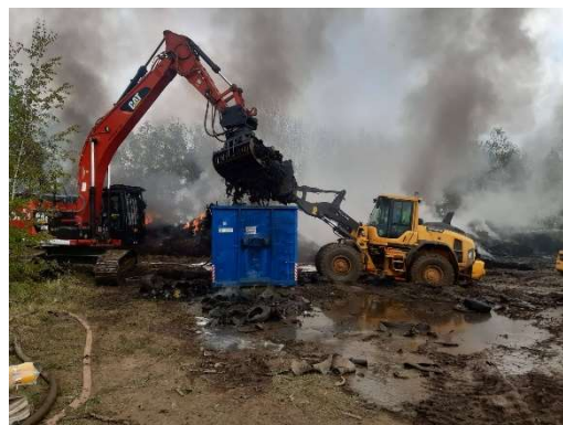
Květen – požár – skládka odpadu v obci Chvaletice