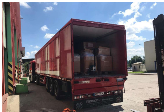
Přeprava zabaveného materiálu pro Celní správu.