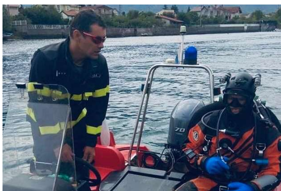
Expertní mise potápěčů při vyhledávání munice v Bosně a Hercegovině.