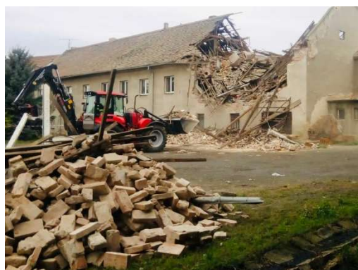
Říjen – technická pomoc – výbuch plynu v Tursku