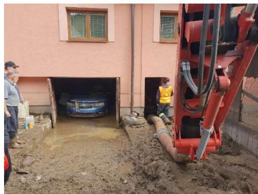
Červen – technická pomoc – odstraňování následků povodní na Olomoucku