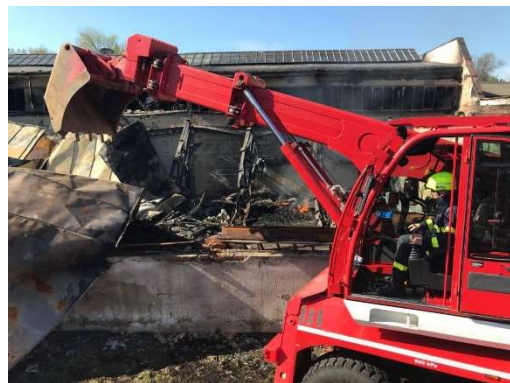
Květen – požár – výrobní hala v Budišově nad Budišovkou