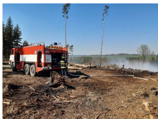
Duben – požár – lesní porost v katastru obce Syrov