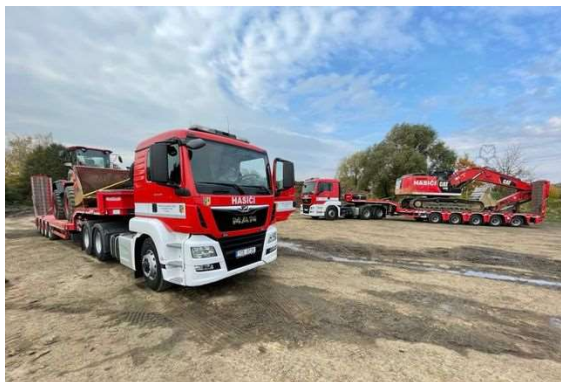
Zemní práce pro HZS MSK.