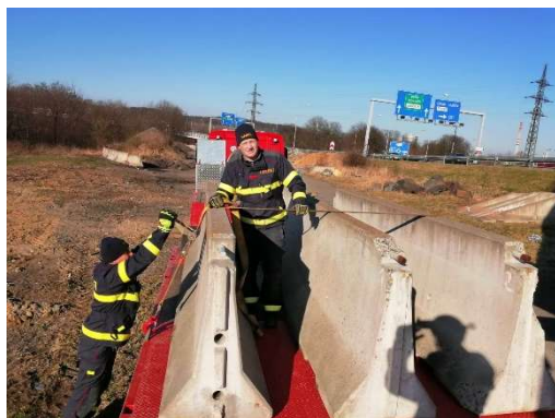
Výstavba stanu pro drive-in odběrová místa a umísťování zábran na hraniční přechody.