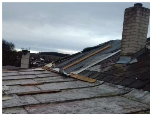
Únor – technická pomoc – upevnění poškozené střechy v obci Puklice