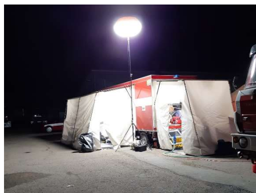
Únor – ostatní mimořádná událost – likvidace nakaženého chovu drůbeže ve Slepoticích