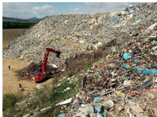
Duben – požár – skládka odpadu v obci Želechovice