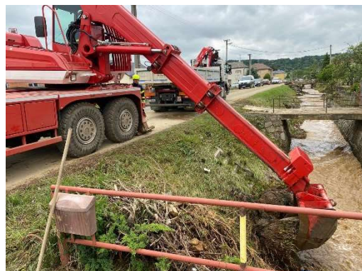
Červen – technická pomoc – odstraňování následků povodní na Olomoucku